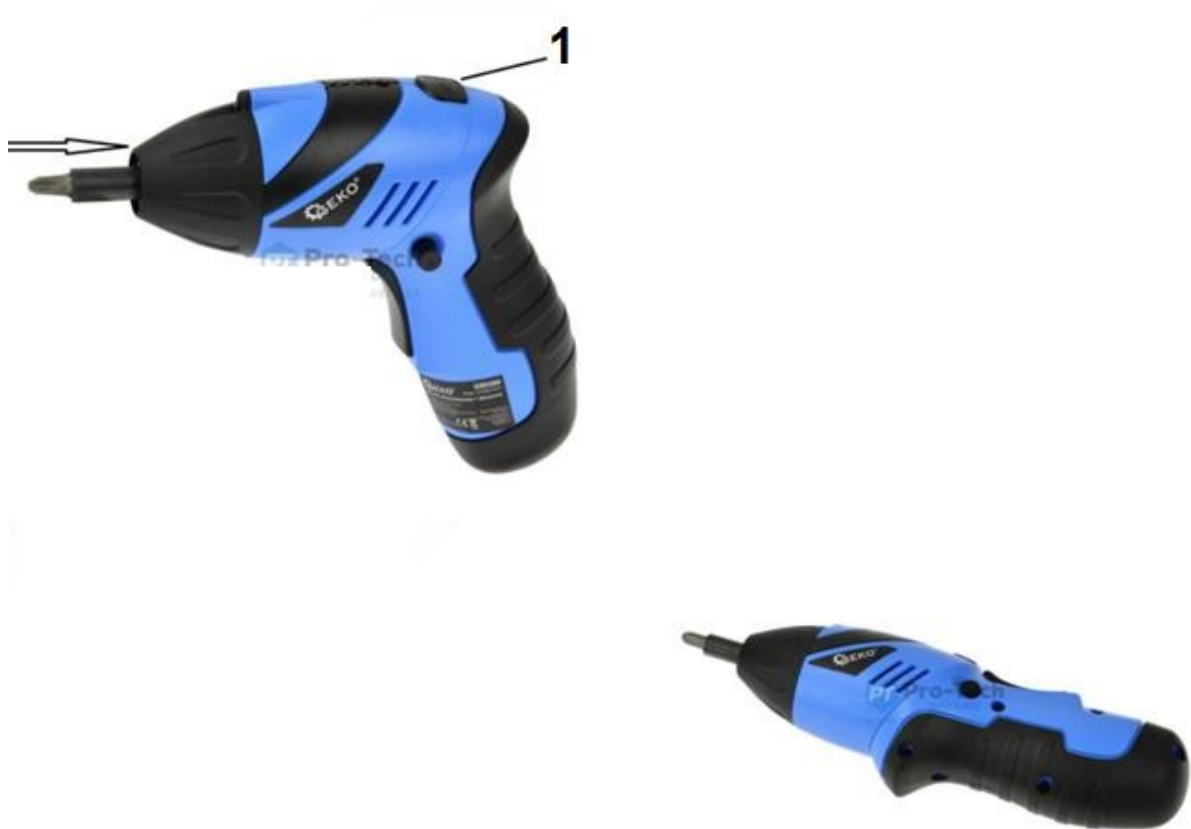
1. Csavarhúzó igazító gomb

az óramutató járásával megegyező irányban. Most már használhatja a csavarhúzót egyenes vonalzóként.